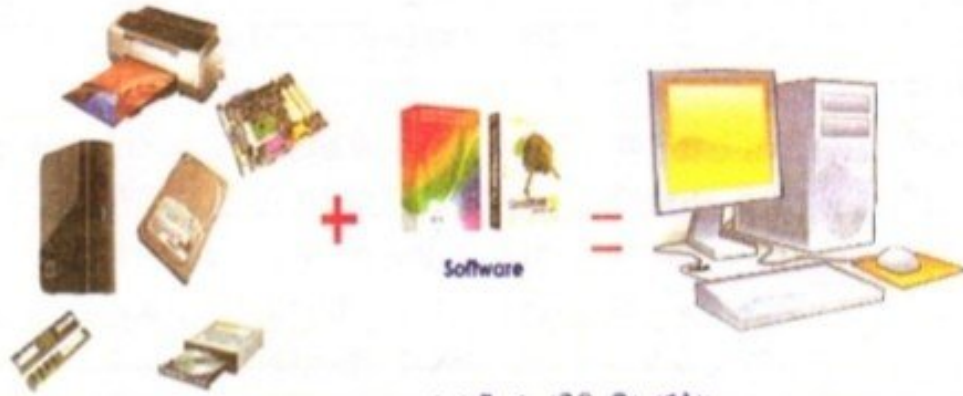
الشكل (2-30) منصة الحاسوب

ويمكن استخدام جهاز الحاسوب في المنزل أو في المكتب أو الدوائر الحكومية والمؤسسات التجارية والعلمية لإيجاد العديد من المهام. وهذا يتطلب الاشتراك بين الأجهزة المادية والبرمجيات للحاسوب وهذا المكون يعرف بـ(المنصة Platform). الشكل (2-30).