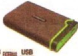
قرص صلب خارجي (متحرك)