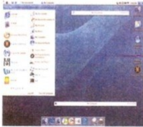
نظام Mac OS (من شركة آبل)