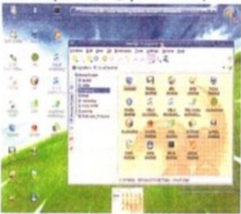
نظام لينكس Linux