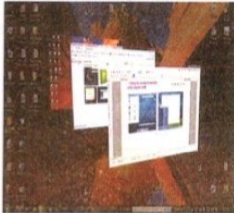
ويندوز 7 Windows 7