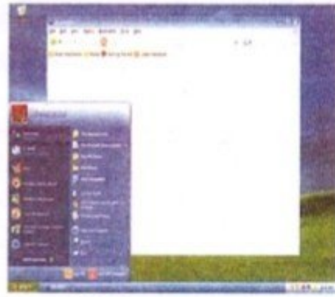
ويندوز اكس بي Windows