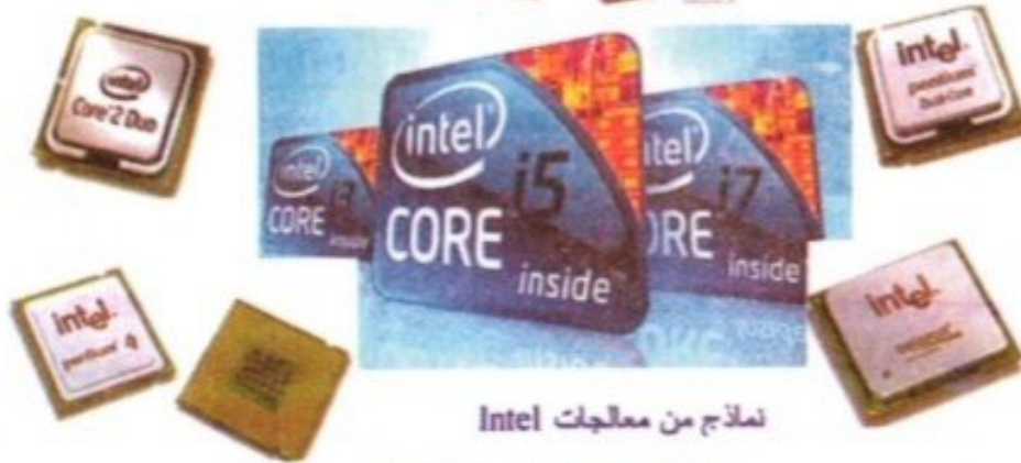
نماذج من معالجات Intel