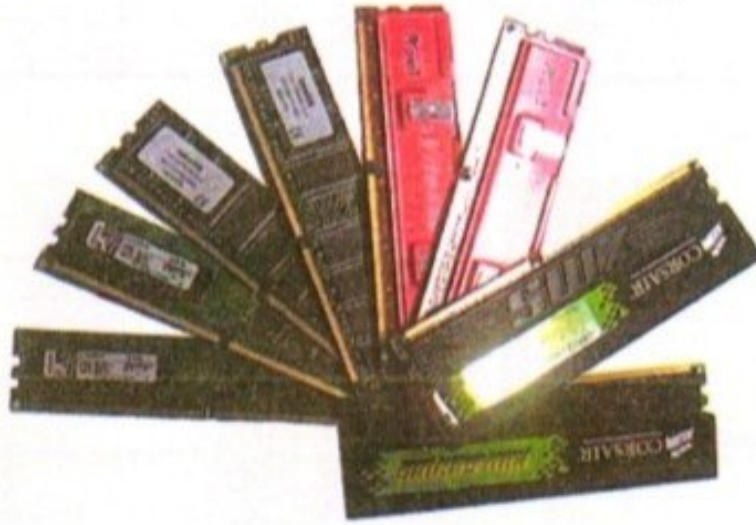
الشكل (2-33) الذاكرة العشوائية RAM

- الذاكرة العشوائية RAM : ينصح بان لا تقل الذاكرة الإجمالية عن 2GB كحد أدنى (واليا تتوفر في الأسواق 8GB)، ويفضل تركيب قطعتين (شريحتين) في حالة دعم المعالج لتقنية القناة الثنائية الذاكرة Memory Dual Channel التي من محاسنها الحصول على ضعف سرعة التردد Frequency Bandwidth وبالتالي زيادة أداء الحاسوب، وأن تكون الذاكرة من نوع DDR بتردد سرعة 400MHz وأما بالنسبة لمعالجات Pentium فإنه من الأفضل اقتناء ذاكرة نوع DDR2 لا تقل سرعتها عن 667MHz. أما لتشغيل الألعاب والتطبيقات بقوة أكبر فمن نوعية DDR3 فهي أقوى وأسرع استجابة الشكل (2-33).