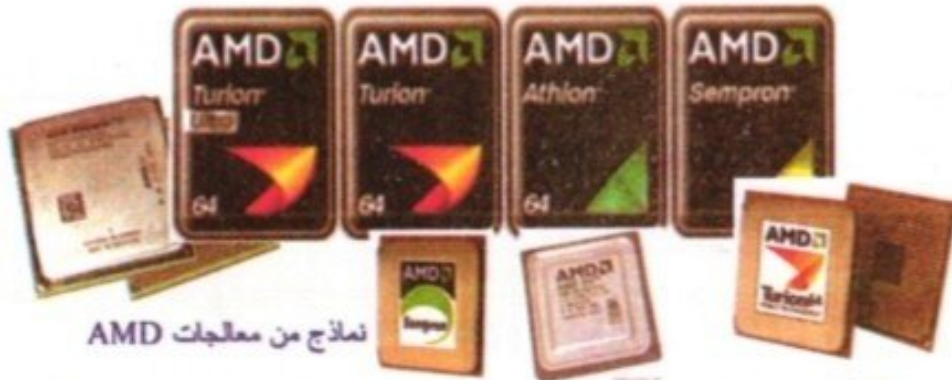
نماذج من معالجات AMD

المعالج: ويعرف أيضاً بـ CPU وهو بمثابة العقل في الحاسوب، لذا ينصح بمعالجات الفئة المتوسطة أو العليا لضمان عمر أطول للحاسوب وسرعة كبيرة حتى وإن لم تكن الحاجة لها حالياً لتضمن لتطوير الحاسوب مع زيادة التطبيقات الحديثة تعد Intel و AMD الشركتي المهيمنة في تصنيع المعالجات، وتشمل عائلة إنتل معالجات مثل Core i7, Pentium, Celeron وكأمثلة على AMD معالجات Phenom, Athlon, Sempron . وتعد معالجات Intel Core 2 Duo كافية لتشغيل الألعاب الحديثة ولتطبيقات أكثر قوة ينصح بمعالج Intel Core 2 Quad وإذا أردنا تشغيل الألعاب والتطبيقات بقوة خارقة فينصح بـ Intel Core i7 . وتقدم إنتل عدة معالجات مثل معالجات بتيوم 4 بتقنية الربط الفائق مع تقنية 64 بت للتوافق مع أنظمة التشغيل. الشكل (2-32).